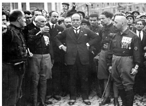
Mussolini alla marcia su Roma

I capi fascisti organizzarono una marcia su Roma (1922) per costringere il governo a dimettersi; il re rifiutò di inviare l'esercito contro i fascisti e, al contrario, invitò Mussolini a formare un nuovo governo. Nelle elezioni del 1924 la lista fascista ottenne la maggioranza.