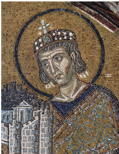
Raffigurazione di Costantino nella basilica di Santa Sofia a Istanbul. L'imperatore, che per la Chiesa Ortodossa è un santo, è raffigurato nell'atto di dedicare la basilica